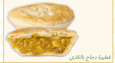
فطيرة دجاج بالكاراي