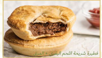
فطيرة شريحة اللحم البقري + المرق

نصنع الفطائر الأسترالية مع كل من الوصفات التقليدية ووصفات الذواقة. ما الأشياء المشتركة بين هذه الفطائر؟ بخلاف كونها رائعة بنسبة 100٪، فهي تحتوي على طبقة علوية من المعجنات الرقيقة والمنتفخة وقوام رقيق وهش، مما يحافظ على الحشو بطريقة رائعة. مع المرق واللصقات السميكة التي لا تتسرب، يمكنك حمل فطيرتك بيد واحدة وتناولها أثناء التنقل!